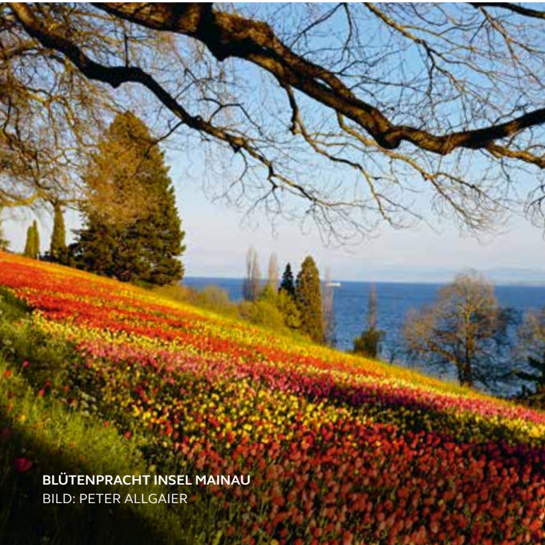
BLÜTENPRACHT INSEL MAINAU