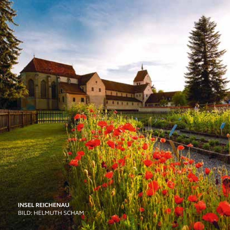
INSEL REICHENAU