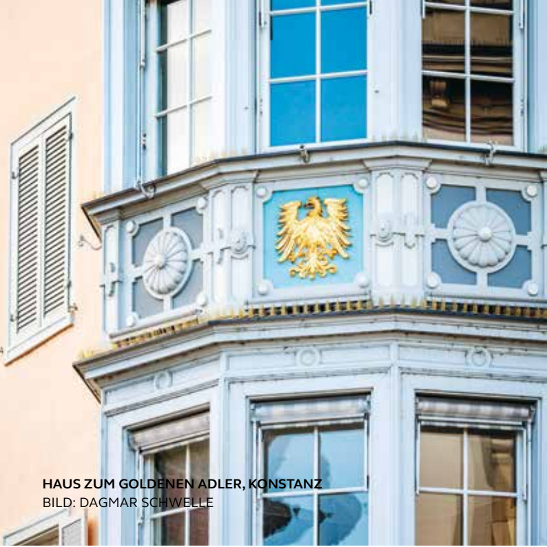
HAUS ZUM GOLDENEN ADLER, KONSTANZ