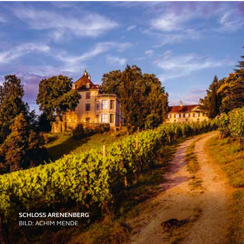
SCHLOSS ARENBERG