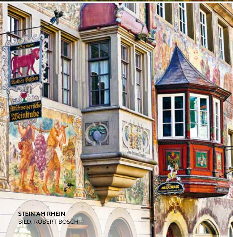
STEIN AM RHEIN